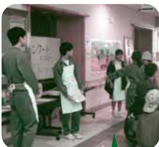
アンケートの呼びかけ