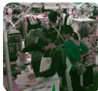
ポップコーンの盛り付け